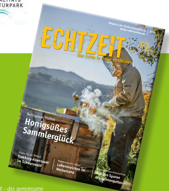
Echtzeit – das gemeinsame Magazin der Großschutzgebiete Baden-Württembergs